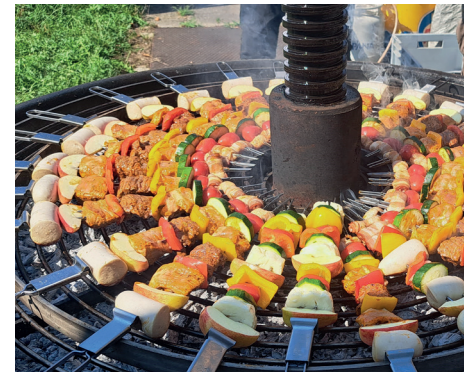
Spießli, Härddöfelsalat, Blechkuchen und natürlich einen Birnenschnaps!