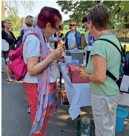
Kafi und Gipfeli auf dem Hof